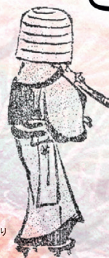
葛飾北斎『北斎漫画 三編』より 虚無僧 墨田区蔵