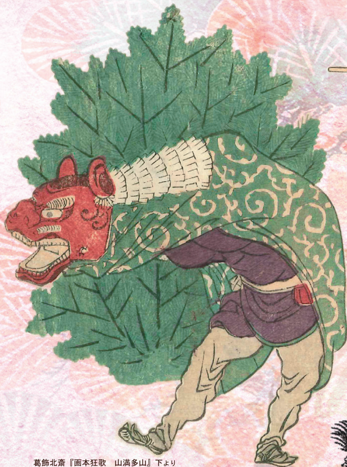
葛飾北斎『画本狂歌 山満多山』下より 獅子舞(部分) 墨田区蔵