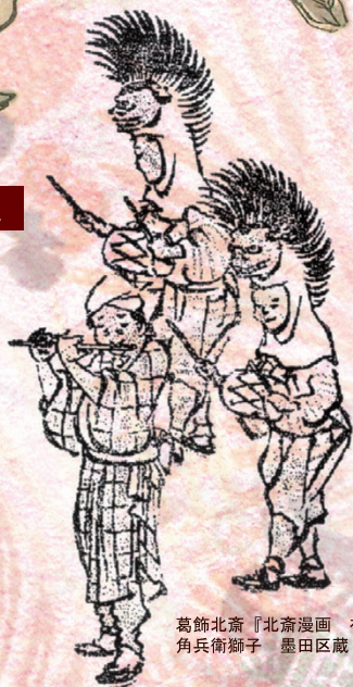
葛飾北斎『北斎漫画 初編』より 角兵衛獅子 墨田区蔵