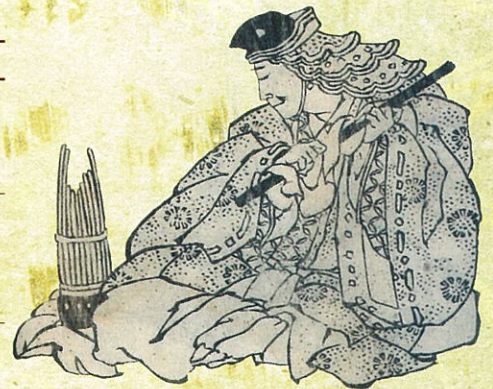
葛飾北斎『秀雅百人一首』「豊原統秋」より

宮内庁式部職楽部楽師として雅楽の伝統を受け継ぎ、楽部首席楽長を務めた後、現在は鳳笙雅楽研究所主宰および日本大学芸術学部講師として、演奏だけにとどまらず、若い世代への雅楽の啓蒙及び伝承活動を行なっている。