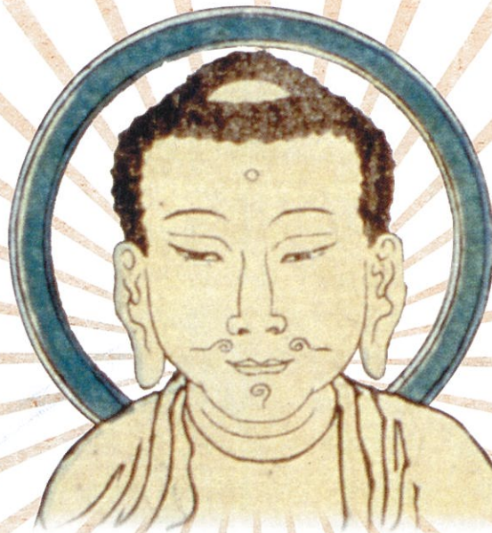
葛飾北斎「鎌倉江ノ島大山新板往来双六」より