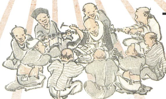
葛飾北斎『北斎漫画』初編より