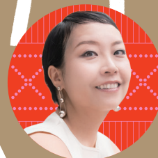
(熊田祥子) [ソプラノ]