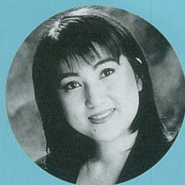
大岩千穂 [ソプラノ] Chiho Oiwa, Soprano