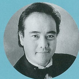
佐野成宏 [テノール] Shigehiro Sano, Tenor