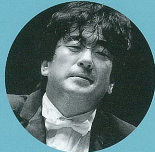
佐渡 裕 [指揮] Yutaka Sado, Conductor