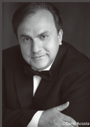
イエフィム・ブロンフマン [ピアノ] Yefim Bronfman [piano]

ピアニストとして華々しく活躍したプロコフィエフにとっては核心ともいえるピアノ音楽、とくに並行して書き進められた第6番、第7番、第8番の3つのソナタは、アメリカ、パリ時代を経て、スターリン独裁下であるにも関わらずソヴィエトに帰国した作曲家の傑作群だ。彼の死の5年後にブロンフマンはタシケントで生まれ、10代半ばから国際舞台で活躍し、イスラエルを経て、1989年にはアメリカの市民権を得た。敬愛するギリシヤリヒテルが生きたソ連は、プロコフィエフの天才的作品とともに、言わばピアニストの故郷ともみられる。いまや50代半ばに差しかかったブロンフマンは、20年ほど前の自身の名録音からもさらなる成熟を聴かせるのに違いない。「20年後には、もっと良い音楽家になっていたい。たくさんのレパートリーを手がけ、同じレパートリーではもっといい演奏ができるように」と微笑む謙虚さとともに、現代の巨匠への道をまっすぐ、実直に歩みながら。