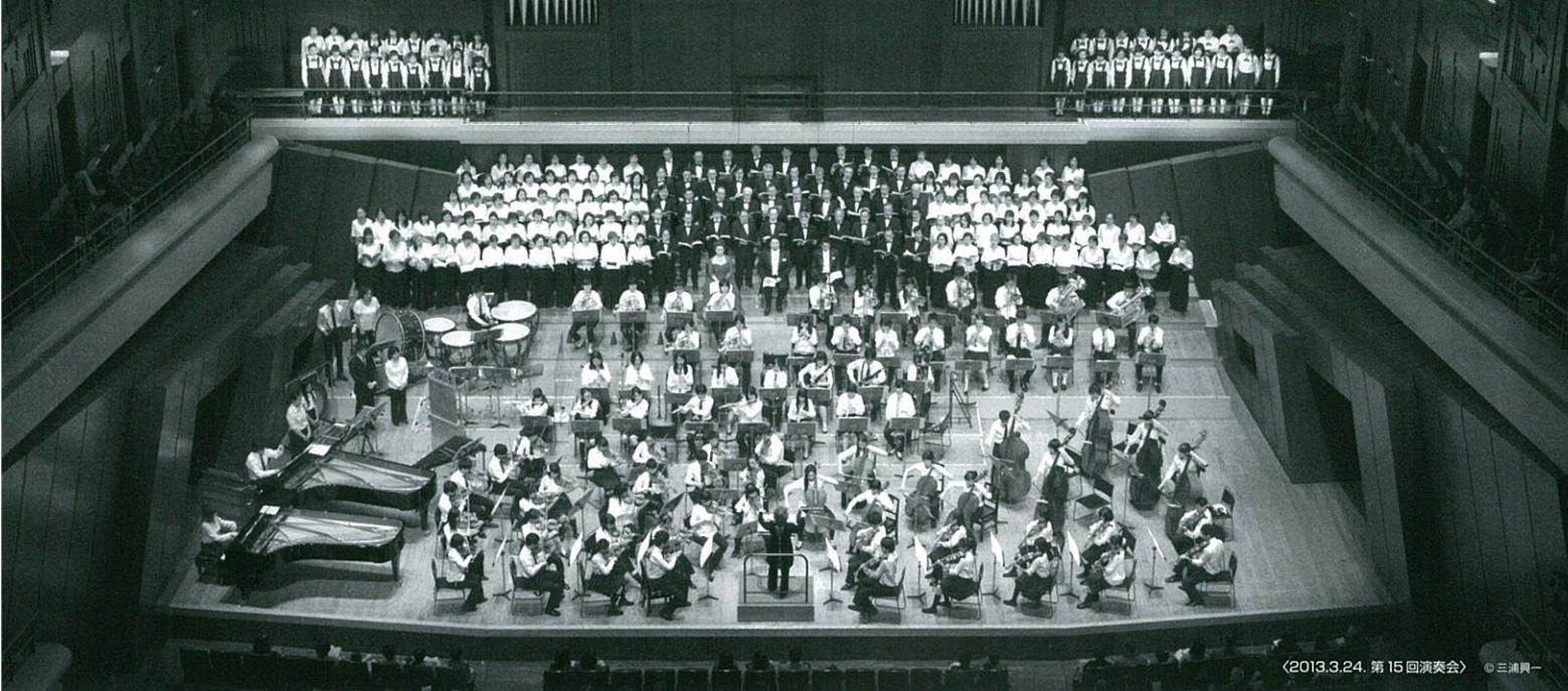
〈2013.3.24. 第15回演奏会〉